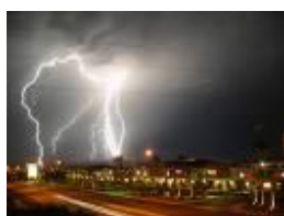
4. hace mal tiempo